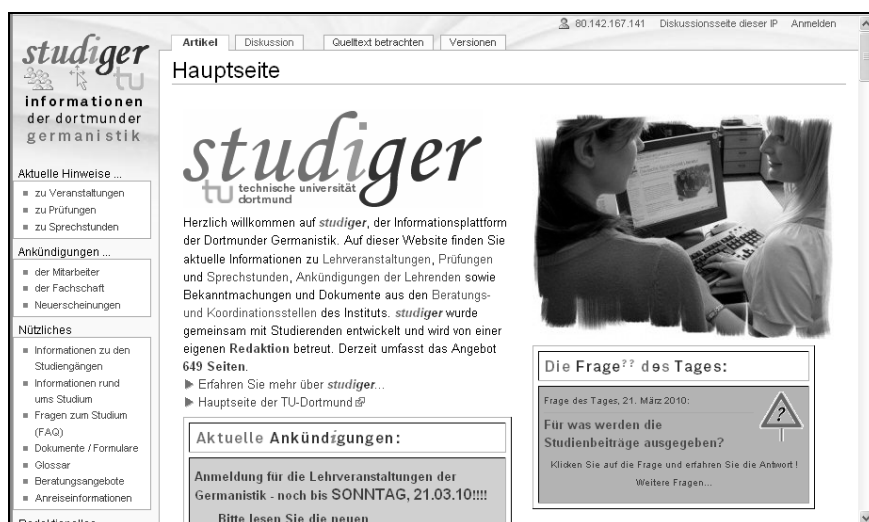
Abb. 3: StudiGer , die wikibasierte Studieninformationsplattform der Dortmunder Germanistik ( http://www.studiger.tu-dortmund.de ).

Pro Woche werden an den Wiki-Seiten durchschnittlich knapp 200 Änderungen vorgenommen, für die z.T. über 20 unterschiedliche BearbeiterInnen verantwortlich zeichnen. Im Schnitt werden etwa 83% der Änderungen von der Redaktion ausgeführt und 17% von den sonstigen Institutsangehörigen und Lehrbeauftragten (die zum Start der Ressource in der Bearbeitung von Wiki-Seiten geschult wurden und in den Sprechstunden der Redaktion bei Bedarf Wiki-Beratung in Anspruch nehmen können). Für die derzeit 648 in StudiGer enthaltenen Wiki-Seiten konnten in den bislang 32 Monaten des Betriebs über 2,2 Millionen Seitenabrufe gezählt werden. Einer Seitenbearbeitung stehen im Schnitt 84 Seitenbetrachtungen gegenüber. Die Startseite wurde während der bisherigen Laufzeit im Schnitt 8.500-mal pro Monat besucht (Stand: 3. März 2010). Inzwischen betreibt ein weiteres Institut der Fakultät – die Dortmunder Anglistik/Amerikanistik – eine Wiki-Plattform ähnlichen Zuschnitts, für die StudiGer als Modell diente und bei deren Konzeption und Aufbau die StudiGer -Redaktion Pate stand ( http://www.iaawiki.tu-dortmund.de ).